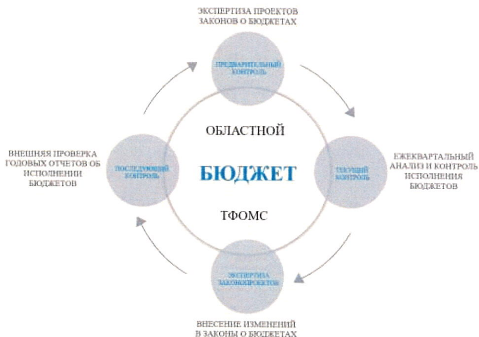
Рисунок 1. Комплекс экспертно-аналитических и контрольных мероприятий, связанных с реализацией полномочий КСП Херсонской области по контролю формирования и исполнения областного бюджета и бюджета ТФОМС Херсонской области

области, проектов законов, приводящих к изменению доходов бюджетов Херсонской области и ТФОМС (рисунок 1).